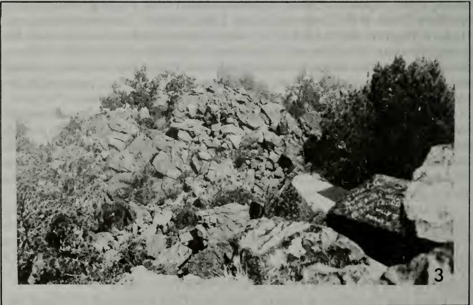
Fig. 3 Las rocas fracturadas y meteorizadas del Cretácico cubren la cima del Pico Duarte.